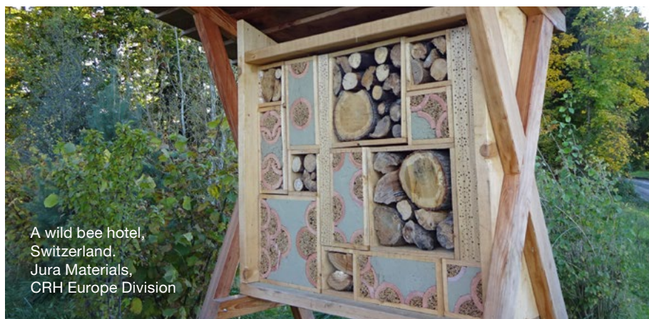
A wild bee hotel, Switzerland. Jura Materials, CRH Europe Division

Uplatňujeme viacúrovňové mechanizmy overovania, aby sme zabezpečili, že naši dodávatelia dodržiavajú štandardy stanovené v tomto Kódexe správania dodávateľov (SCoC). Spôsoby overovania sa určujú na základe: